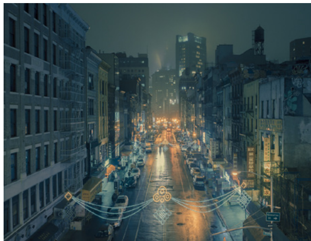
Frank Bohbot, East Broadway 2nd night, Chinatown , 2014 Gagnant d'Archifoto 2014 (thème : Les 1001 couleurs de l'architecture)