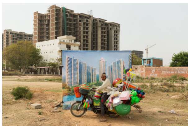
Arthur Crestani, Bad City Dreams , Gurgaon, Inde, 2017 Gagnant d'Archifoto 2017 (thème : Changer la vie, changer la ville)