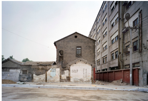
Patrick Tourneboeuf, Traces , Beijing, 2010 Gagnant d'Archifoto 2010 (thème : L'architecture, c'est durable !)

Toutes les images des éditions précédentes sur → www.archifoto.org