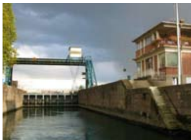
Sortie "architecture au fil de l'eau Batorama JA 2009"

Chaque année, les Journées de l'architecture proposent, à l'automne, quelque 150 événements en Alsace, dans le Bade-Wurtemberg et à Bâle autour d'une thématique précise (2006 « Mieux vivre » ; 2007 « Lire l'architecture » ; 2008 « Quoi de neuf en architecture ? » ; 2009 « l'architecture en mouvement(s) » ; 2010 « 10 ans, 3 pays, 1 idée : l'architecture, c'est durable ! ») et à destination du grand public.