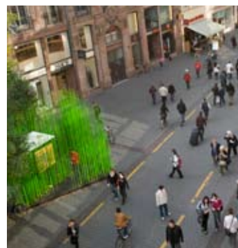
Infobox Journées de l'architecture 2009, collectif 3rs

L'association Les Journées de l'architecture / Die Architekturtag a pour objectif principal de mieux faire connaître et apprécier l'architecture à des publics de plus en plus nombreux et variés. Elle aspire à l'émergence d'un espace rhénan commun de l'architecture, passant par une pérennisation de toutes sortes de manifestations autour de cet art, de ses problématiques, de ses réalisations et de ses protagonistes.