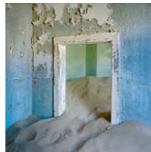
Exposition Olivier Culmann à la Chambre, 2009 dans le cadre des Journées de l'architecture