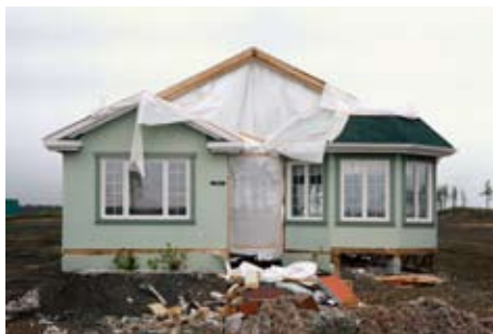
Exposition Isabelle Hayeur au Maillon - Wacken, 2009 dans le cadre des Journées de l'architecture © Isabelle Hayeur